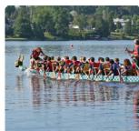
das Drachenbootrennen auf der Saar