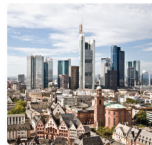
Frankfurt am Main