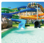
das Tropical Island