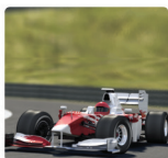
der Nürburgring in Nürburg